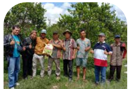
13 Feb Penyuluhan jeruk dan cabai sekaligus tinjauan langsung di kebun Lai Malna- sal Kec. Sumbul Kab. Dairi