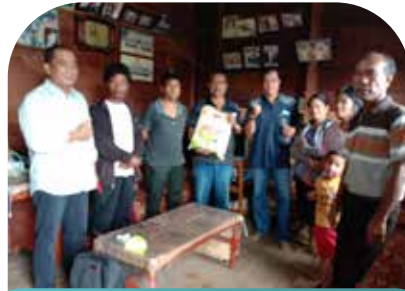
12 Feb Penyuluhan padi dan cabai di Ds. Pardede Kec. Balige Kab Toba