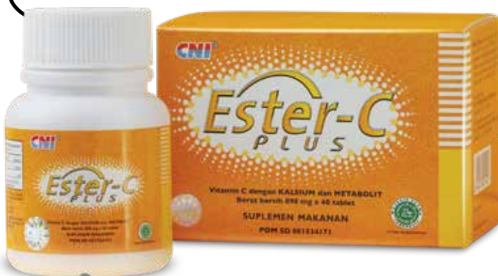
CNI Ester-C Plus