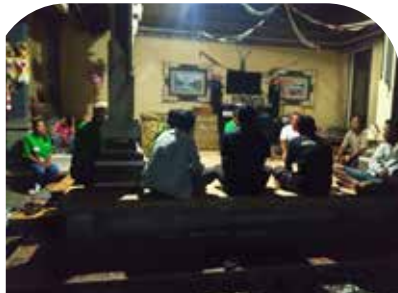
14 Feb Penyuluhan Plant Catalyst untuk semangka air di Sumbul, Mendoyo, Jembrana, Bali