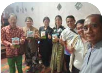
12 Feb Sharing dengan para motor penggerak di Dolok Sanggul Kab. Humbang Hasundutan