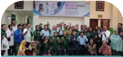
9 Feb Foto Bersama Product Workshop di Hotel Kaliani Inn Medan