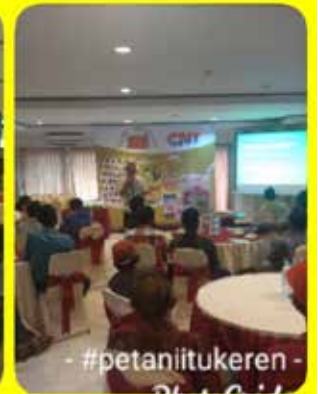
15 Feb Seminar di Hotel Jimbarwarna Negara, Jembrana, Bali