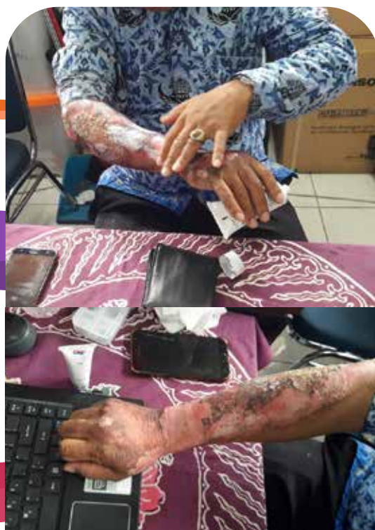
Luka hari ke 5 (sudah mulai kempes dan kering setelah dioles Nutrimoist)