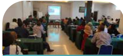
9 Feb Product Worskhop Plant Catalyst di Hotel Kailani Inn Medan