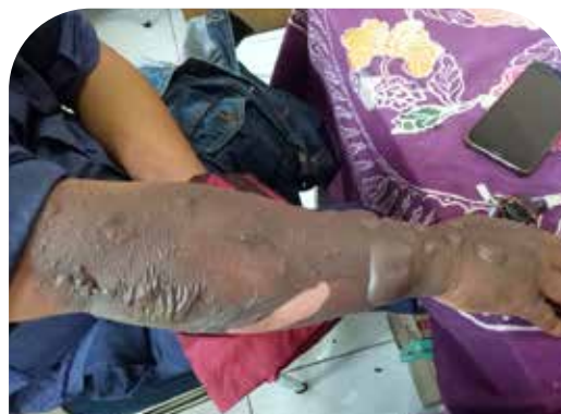
Luka pada hari ke 2 (sebelum pakai Nutrimoist, kulit menghitam dan melepuh)

“Setiap hari saya selalu rutin mengaplikasikan Nutrimoist dan setelah 4 minggu luka bakar saya sudah sembuh dengan bekas luka yang sangat minim.”