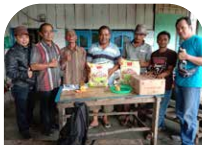
13 Feb Kontak tani jeruk di Ds Beringin 1 Kec. Sumbul Kab. Dairi