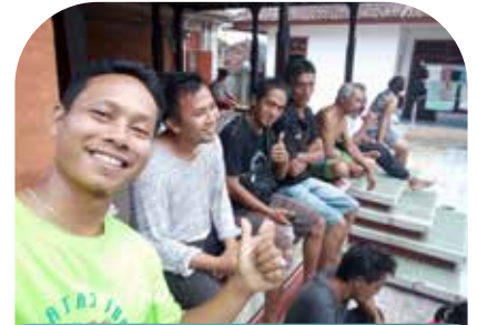
14 Feb Penyuluhan di Subak Bading Kayu Pekutatan, Jembrana Bali