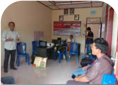
12 Feb Penyuluhan di kantor Ds. Panca Pukka Sianipar Kec. Balige Kab. Toba