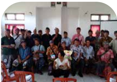
15 Feb Penyuluhan ke para pekaseh (ketua kelompok tani) subak basah (sawah) dan subak kering (ladang) di BPP Selemadeg Tabanan Bali