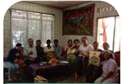
12 Feb Penyuluhan Plant Catalyst di Sibuntuon Balige Kab Toba