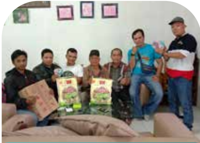
13 Feb Penyuluhan ke Pengepul Jeruk Kec. Sumbul Kab. Dairi