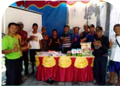
13 Feb Penyuluhan Plant Catalyst di Subak Beji Sangsit Singaraja Bali